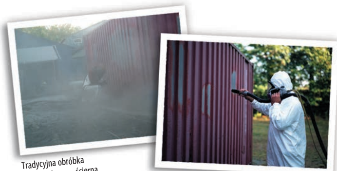
Tradycyjna obróbka strumieniowo – ścierna